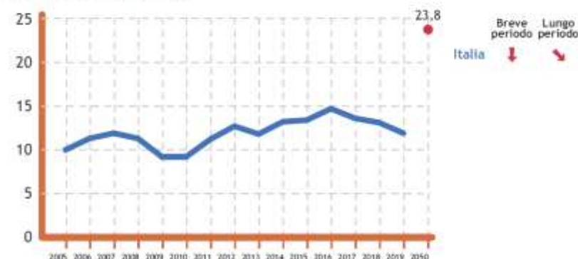
Target 9.1 - Entro il 2050 raddoppiare la quota del traffico merci su ferrovia rispetto al 2019

Per valutare il raggiungimento degli obiettivi quantitativi è stata usata la metodologia Eurostat, che prevede la valutazione dell'intensità e della direzione verso cui l'indicatore si sta muovendo rispetto all'obiettivo prefissato utilizzando delle "freccette".