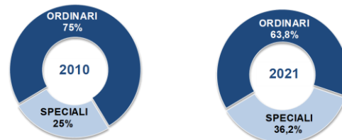
APPALTI PUBBLICI PER LAVORI Composiz.% del valore a base di gara (bandi e inviti di importo ≥40mila€) per tipologia di settore