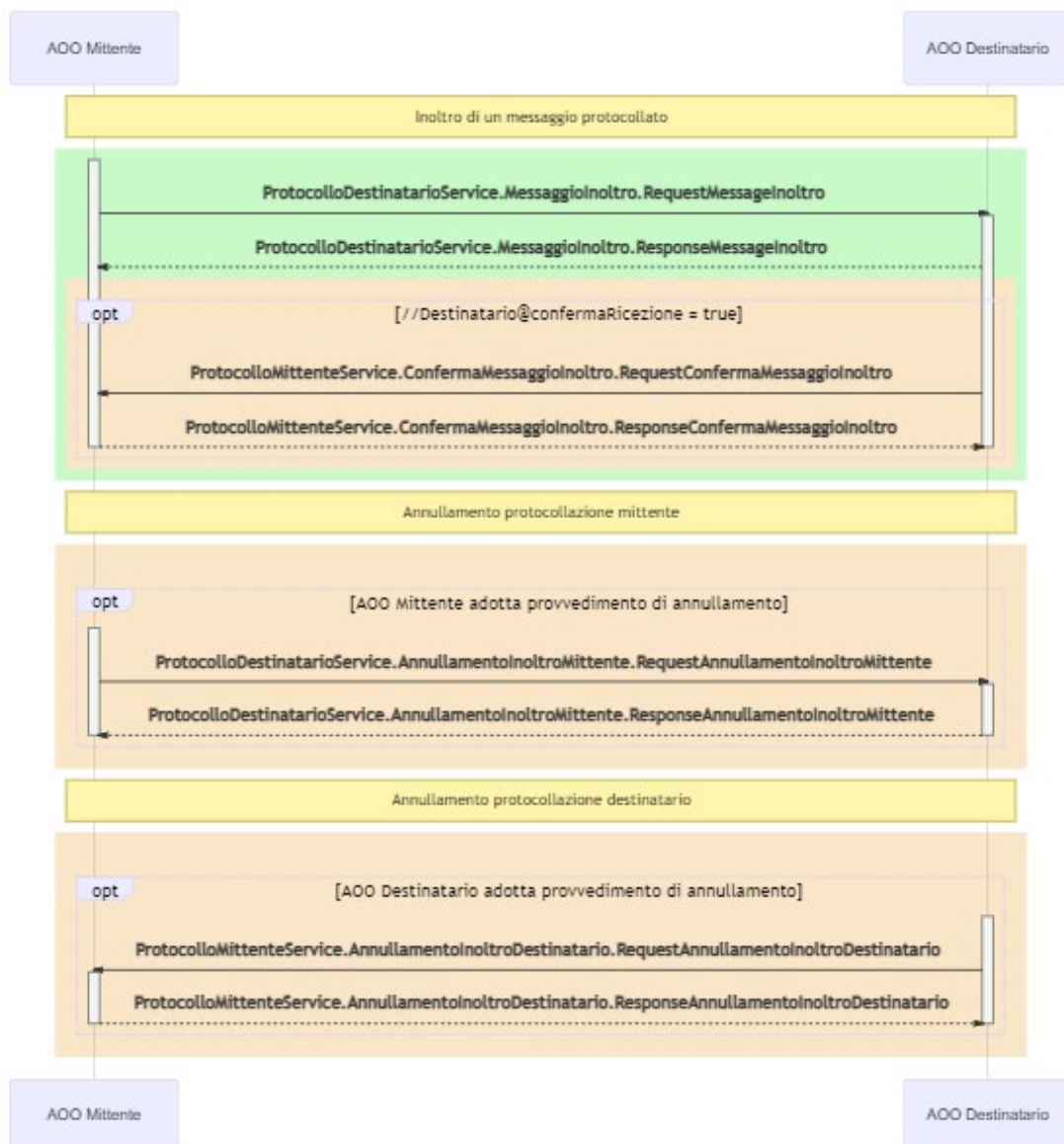
Figure 2. Comunicazioni tra AOO mittente e AOO destinatario

Le esigenze di comunicazione individuate sono sintetizzate nel seguente UML sequence diagram.