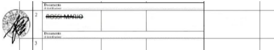
Esempio di correzione

NON PROCEDERE MAI DI PROPRIA INIZIATIVA ALLA CORREZIONE DEGLI ERRORI CON CANCELLATURE E SBIANCCHETTAMENTI!